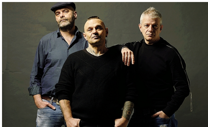
199 Posse in scena domani al «Fara Rock» di Fara Gera d'Adda

Söche e melù, ògna fröt a la sò stagiù Zucche e meloni, ogni frutto alla propria stagione