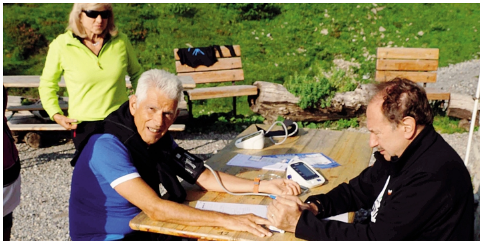
I volontari e gli operatori della Giornata dell'ipertensione domenica saranno presenti anche in otto rifugi alpini della provincia di Bergamo