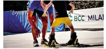
Un istruttore con un allievo sulla pista in piazza della Rocca