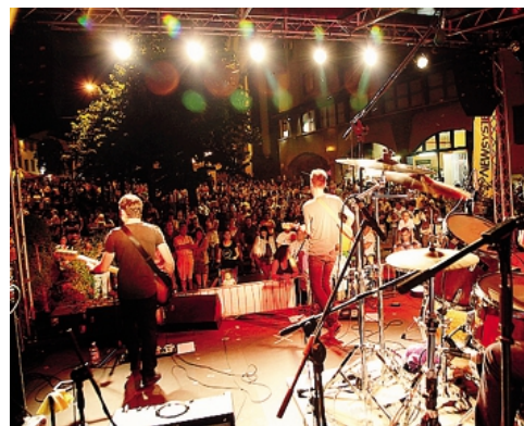
Stasera in scena le tribute band di Nirvana e Foo Fighters