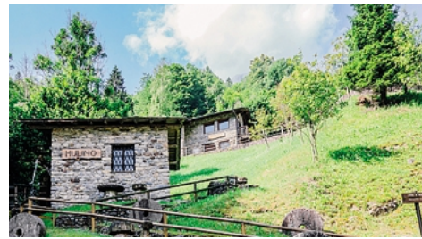
Il mulino è una delle tappe del percorso dell'Ecomuseo a Valtorta

Valtorta Appuntamento sabato per un percorso enogastronomico con tappe al mulino, museo e chiesa