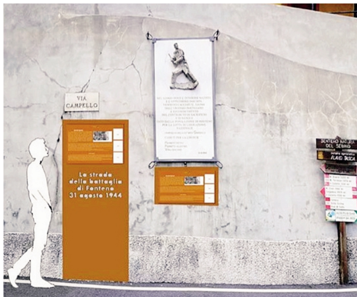
Una delle otto stazioni commemorative della battaglia del 31 agosto 1944

«Lo definirei un progetto della comunità – ha detto Mauro Magistrati, presidente Anpi Bergamo – diamo la possibilità di stabilire contatti con la storia della Resistenza, andando nei luoghi dove fu combattuta. In più abbiamo riservato una grande attenzione all'ambiente. Diceva Italo Calvino che «la Resistenza rappresentò la fusione di paesaggio e persone». Credo che la Strada della Battaglia restituisca bene anche questo aspetto dell'esperienza partigiana».