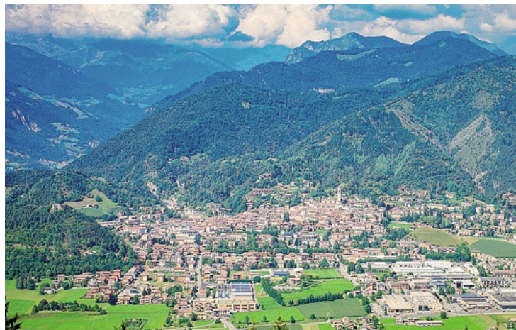
Prima edizione del Festival della Montagna che riunisce le diverse associazioni del territorio