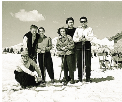
Anche foto d'epoca in mostra al Festival della Montagna