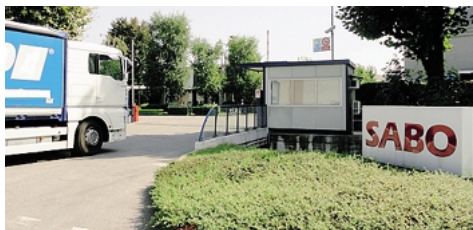
La sede dell'azienda chimica Sabo a Levate

In Consiglio comunale il piano attuativo in variante al pgt (piano del governo del territorio) ha avuto quindi via libera definitiva. La Sabo, nei prossimi 10 anni, potrà espandersi all'interno del proprio perimetro fino a un massimo di 4 mila metri quadri. In uno dei punti dell'osservazione si chiedeva che il via libera all'ampliamento edilizio dell'azienda chimica ve-