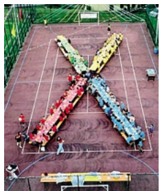
I colori delle 4 contrade in lizza

A Strozza, dopo di anni di «silenzio» è tornata ad animare la comunità la manifestazione del «Palio delle contrade» che ha visto sfidarsi in quattro colori diversi, azzurro, verde, giallo, rosso, quattro zone del paese: Amagno, Ca' Campo e Cabrozzo, via Provinciale e via Vittorio