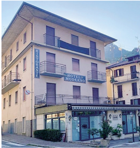
L'Hotel Moderno a San Pellegrino Terme

Oltre al convitto, l'idea alla base del progetto è rilanciare l'intera struttura coinvolgendo gli studenti dell'Istituto. «Vogliamo ampliare l'offerta dell'albergo - continua Bea-