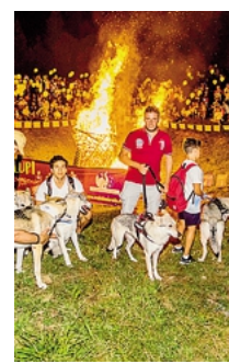
Un'edizione della marcia