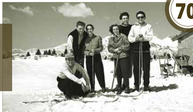
Pianone, 1951